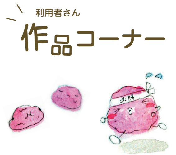
歌詞写経「梅干しの歌」