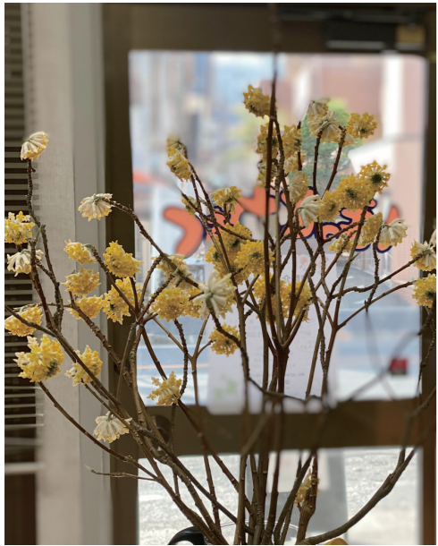
利用者さん宅のお庭で咲いた「ミツバタ」です。先端が3つに枝分かれています。